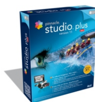
Pinnacle Studio Plus Ver. 11