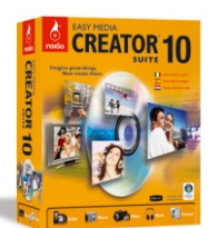
ROXIO Easy Media Creator