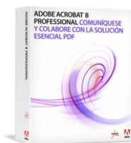
Acrobat Profesional 8