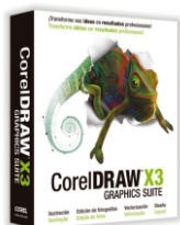
CorelDRAW Graphics Suite